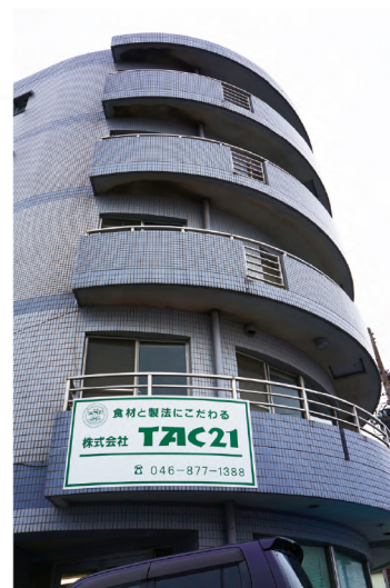
▲葉山町の真名瀬海岸に建つ営業所。美しい海辺と緑豊かな丘を望む環境にて製造を行っている。

平成 26 年より地元逗子で収穫した素材である海藻アカモクを利用した様々な商品化を行い地域活性化に繋げている。