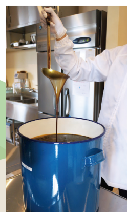
◀ 天日干しあかもくを漬け込んだ醤油や酢を製造